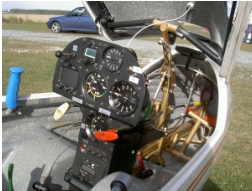
Instrumentbrädan på vår nya Ls4