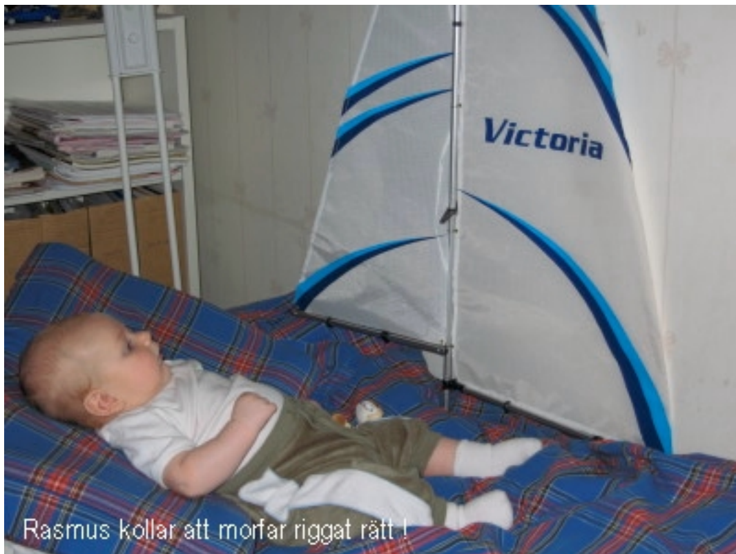
Rasmus kollar att morfar riggat rätt!