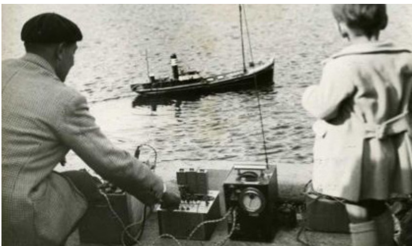
En tidig utrustning för r/c. Inget man bär med sig under armen.