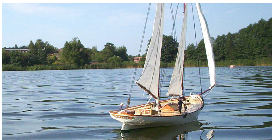
Snart är det dags för sjösättning!