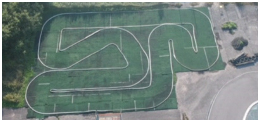
Flygfoto på nya 1:10 buggybanan.

Vi tog så klart chansen och började rigga i ordning allt som hade med transport att göra då det behövdes en lastbil med kran för att kunna lasta