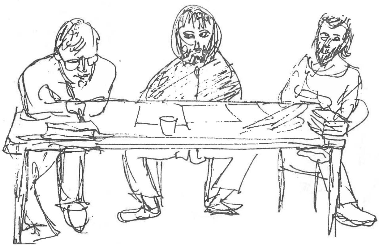
Några profiler. Ur redaktörens skissblock. Från årsmötet.