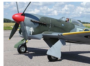
MFN pratar om Siverts Tempest, vi visar bilderna!