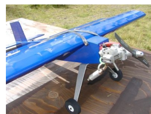
Månadens modell: The Thing.