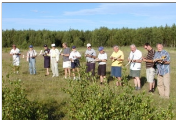
Klara för start!

(Stort reportage finns också i Modellflygnytt 4/2003, Red.anm.)