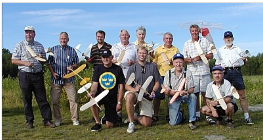
Och den traditionella gruppbilden.