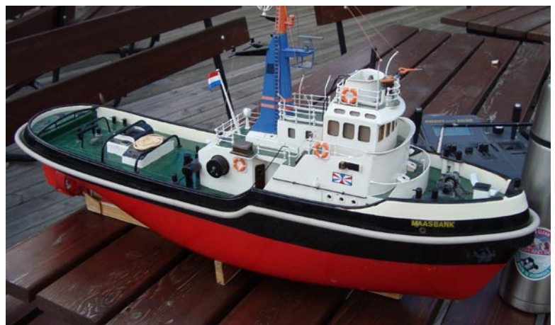
En väl detaljerad bogserbåt.