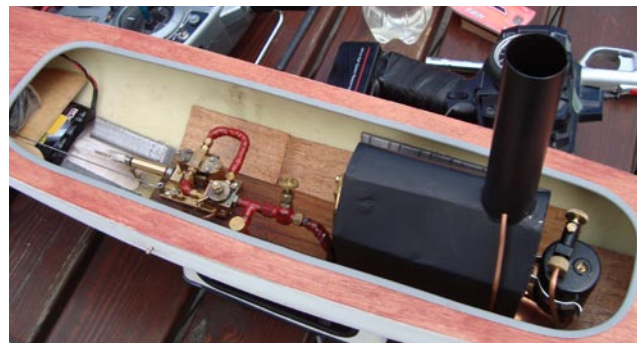
En fantastisk snygg installation av ångmaskin!