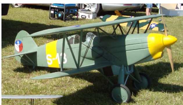
Sotarns imponerande Avia fanns förstås på plats.