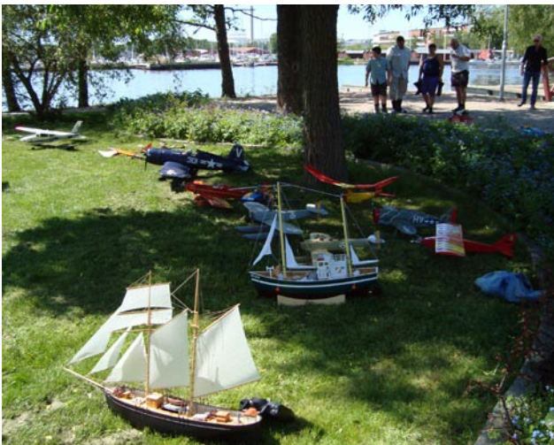
Besökarna hade mycket att titta på bland de utställda flyg- och båtmodellerna.

för våra modeller och det borde vara flera av dessa som fick inspiration till egna modellbyggen och kanske kan vi få ytterligare några nya medlemmar till klubben. Evenemanget är populärt och vi kommer igen nästa år!