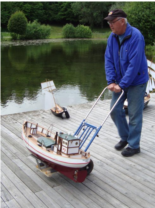
Ett smart sätt att transportera tunga båtar. Man ska vara rädd om ryggen!