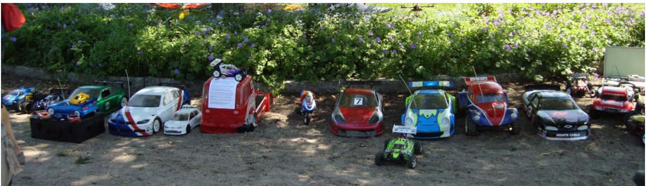
Bilsektionen hade ställt ut ett imponerande antal bilar av alla sorter och i olika skalor.