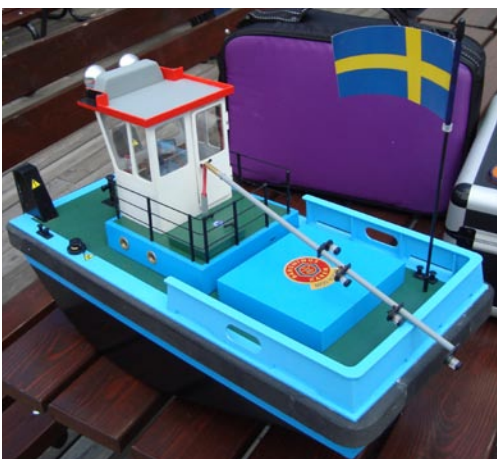
Märkligt flytetyg men den flöt och fungerade!