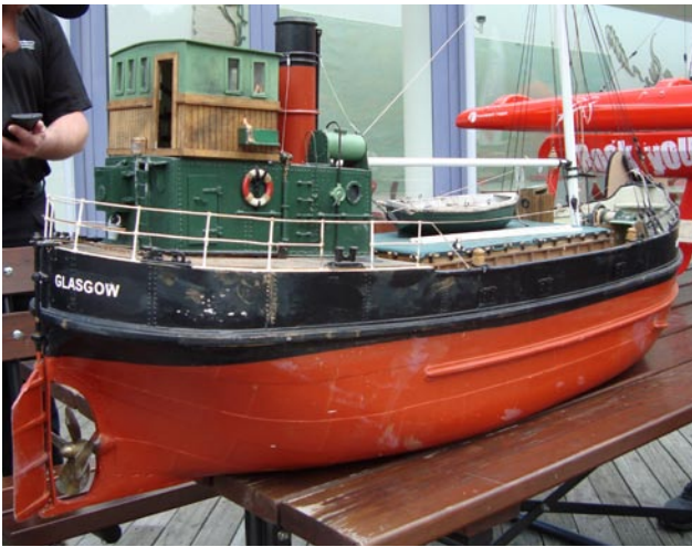
En väldigt fin och välbyggd båt med massor av fina detaljer och realistisk "vädring".