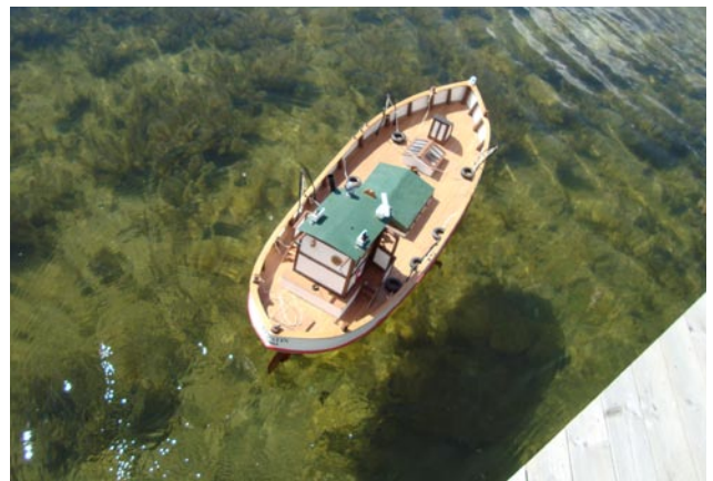
Glasklart vatten! Man ser botten och båtens skugga.