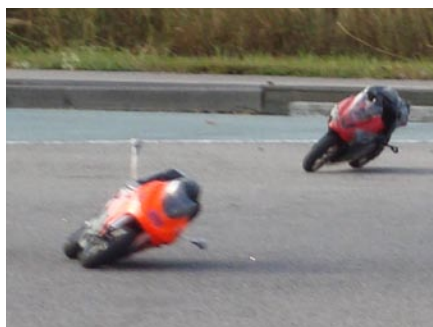
Bilsektionen har utvidgat verksamheten med mc-körning - väldigt knepigt men vansinnigt roligt!