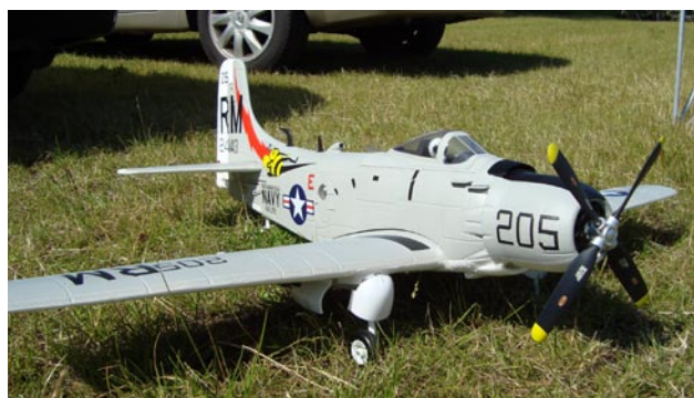
Bertil hade med sig sin detaljrika skalamodel.