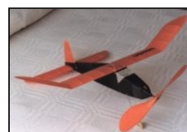
Bygg en Senator!