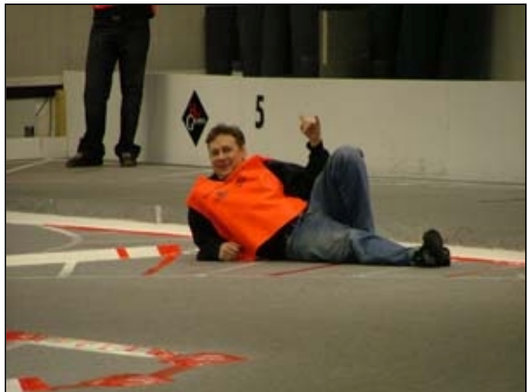
Ippa, 2005 års kurvsvakt!