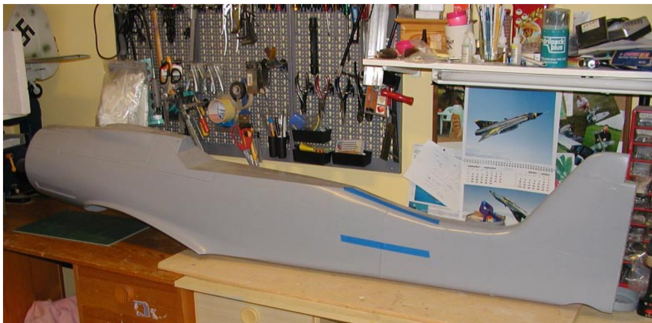
En låååååång glasfiberkropp till en Fw190D9. Den sparar in flera års jobb!