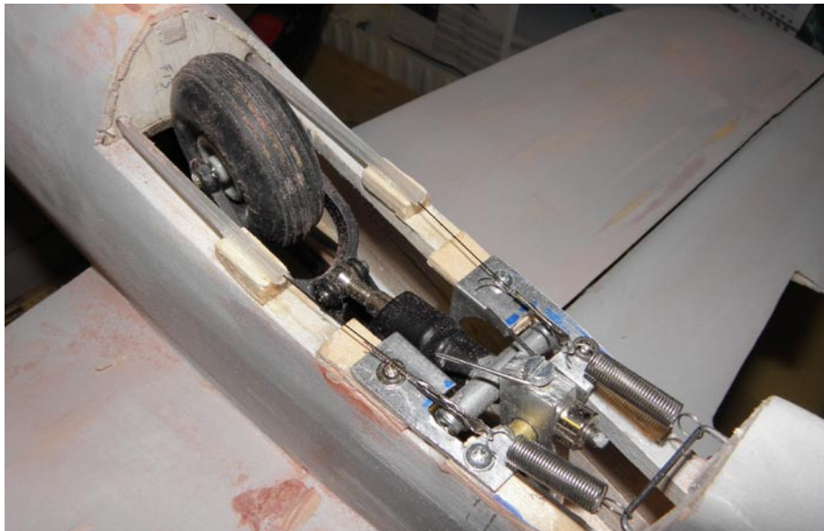
Det infällbara sporrhjulet som äntligen fått en lösning!