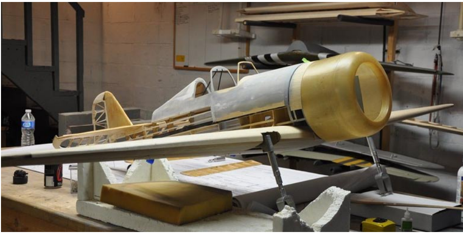
Jag fick tag på ett nytt projekt under den här resan. Snart har jag lika många plan i USA som jag har här hemma. Detta är en Fokker DXXI av Jerry Bates design. Skalan är 1:5,5.