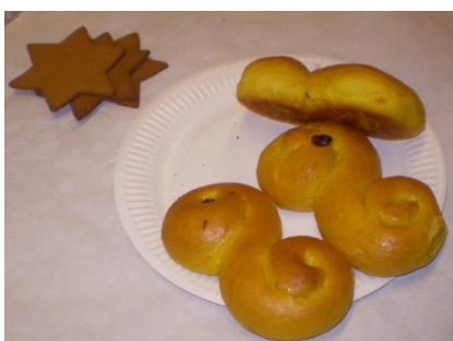
Princess hade som vanligt ordnat med gott fikabröd.

DEN 15 DECEMBER 2011 inbjöd NMK till traditionellt lussefika. Ett tjugotal medlemmar fyllde lokalen och somliga hade tagit med sig sina pågående projekt.