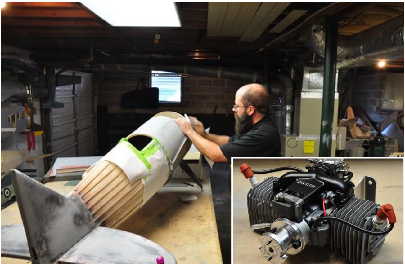
Jag jobbar fortfarande på min Laird Turner racer. Den är klar för klädsel, målning och installation av elektroniken.