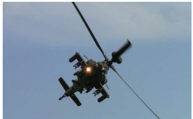
En Apache fokuserar ljuset på oss...den ser lite elakare ut jämfört med den gula glada helikoptern...