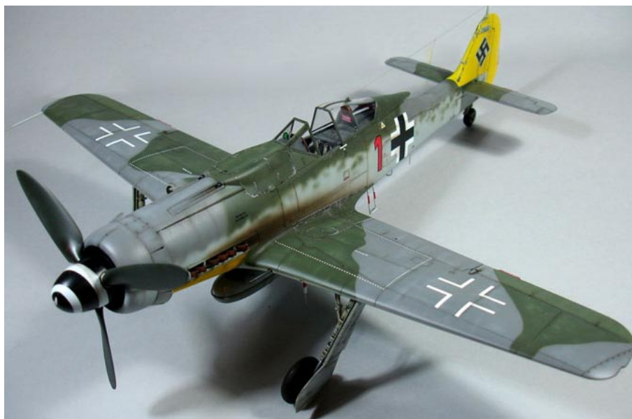
Fw190-2: Hartenmanns Rot 1.