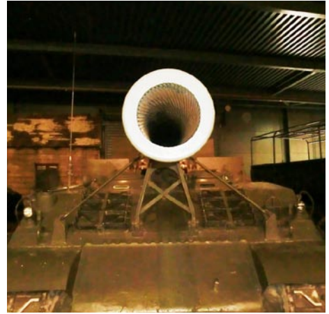
Det är inte bara flyg på Duxford, det finns även ett fint Pansarmuseum som hälsade oss välkomna!