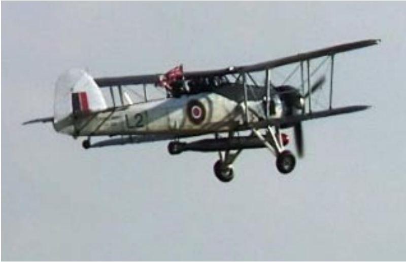
Union Jack måste vädras ibland...