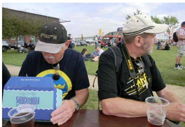
För att orka med en flygdag på Duxford krävs det Fish & Chips och en "Spitfire"!