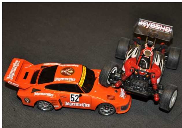
Smurfens båda bilar. Ni minns kanske förra numret när smurfen hade sin Porsche och sin offroadbil i skala 1:5 med. Även i Mini-z har han en Porsche och en buggy.