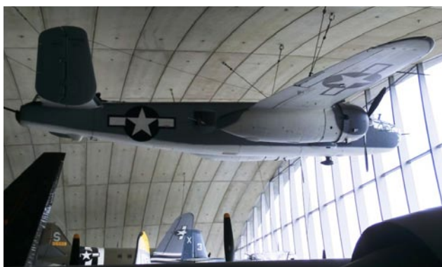
Det amerikanska museet på Duxford är "ganska" stort, man har bla klämt upp en B-25 i taket! Den skarpsynte kan också skymta fenan på en B-52, som sagt det är stort!

ning med "fullskala kärror" på Duxford norr om London. Här följer en liten bildkavalkad från denna fantastiska lördag! Se & njut!