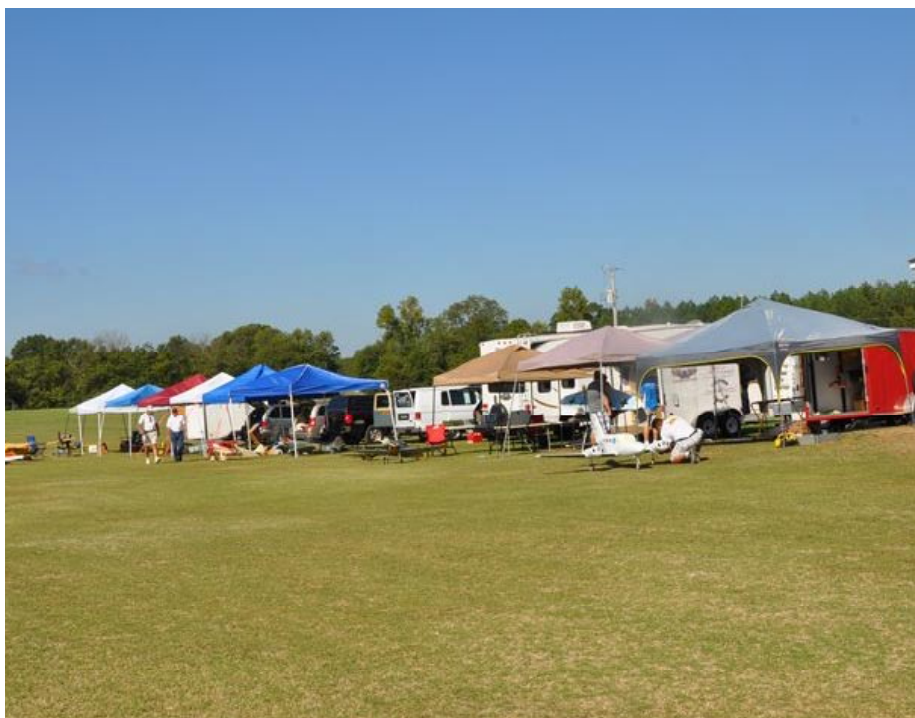
Vy från Mac Hodges flygfält i Georgia. Vy åt andra hållet.

Eftersom jag har upptäckt ett sätt att transportera stora modeller på ett relativt billigt sätt så kommer jag att ta med mig en flygande modell nästa år. Förhoppningsvis blir det mitt äldsta projekt – B-25:an.