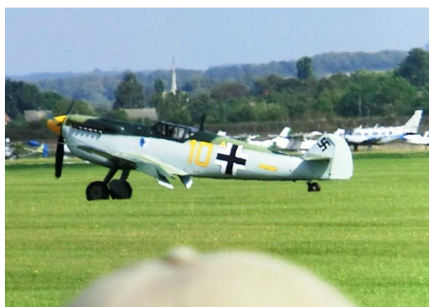
Tysken var också på besök!