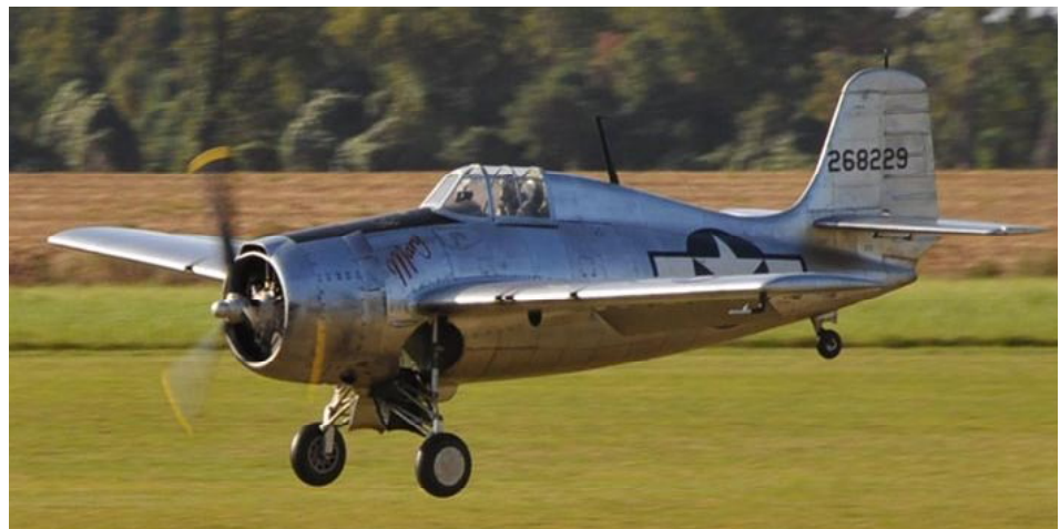
Scott Prossens model som har en finish som är helt otrolig.