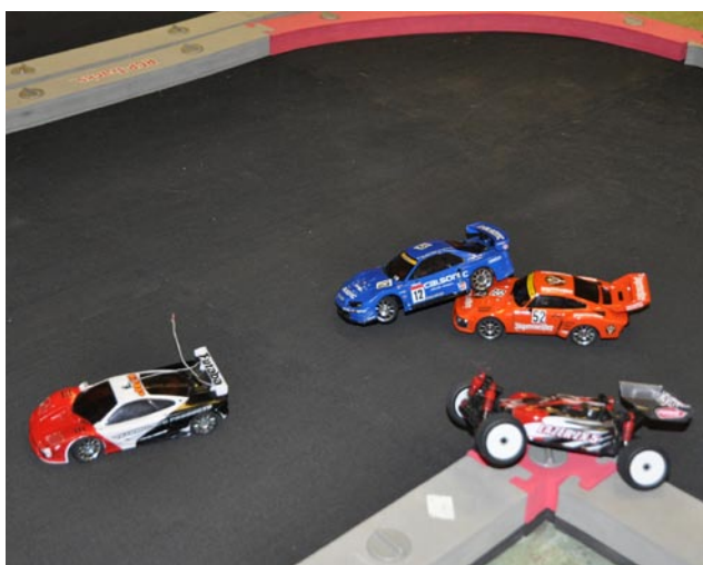
Brukar vara trångt i första kurvan.

långsammare. Racen körs i 5 eller 9 minuters pass. Bilarna varierar i skick och utförande. Allt från standardbilar till bilar med trimmade motorer och chassijusteringar. Finns både som onroadbil och offroadbil. Det är ganska ofta närkamp på banan då det är trångt och bilarna går fort. Men det hör lite av charmen till. Smurfen