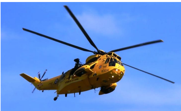
En gul glad helikopter visade upp sig.