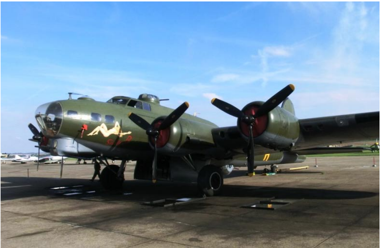
Vackrast på Duxford? B17 "Sally B" visar upp sig!