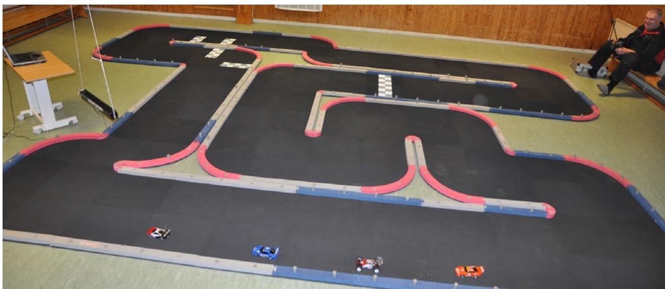
Banan i sin helhet. Full fart på bilarna på rakan.