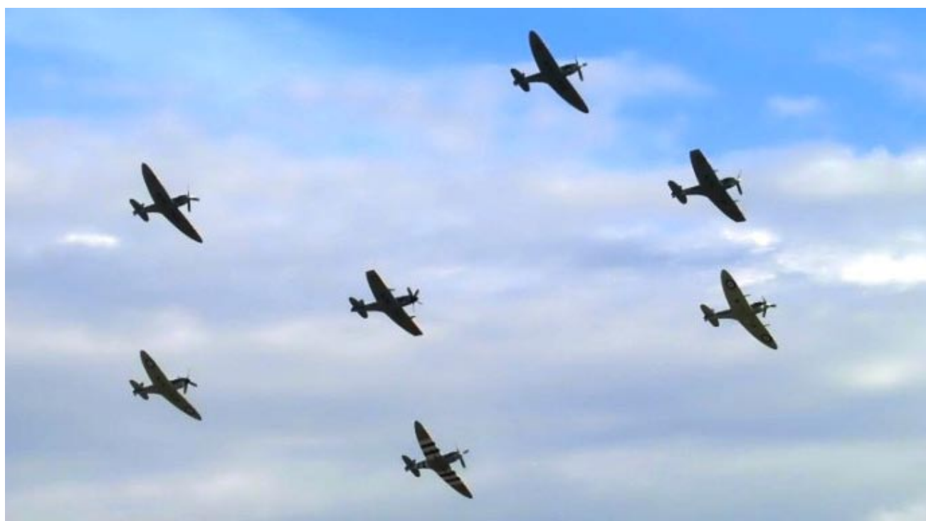
Avslutningsvis huvudnumret för dagen, det var ju trots allt 75-års kalas för Spitfire. Sju st Spitfire i snygg formering, det gav gåshud på armarna!