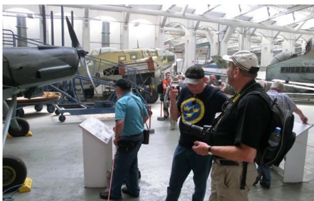
Senior funderar på något i en av renoverings/restaureringshangarerna, undrar vad? Mycket projekt har dom på gång, man blir nog tvungen att åka tillbaka om några år...