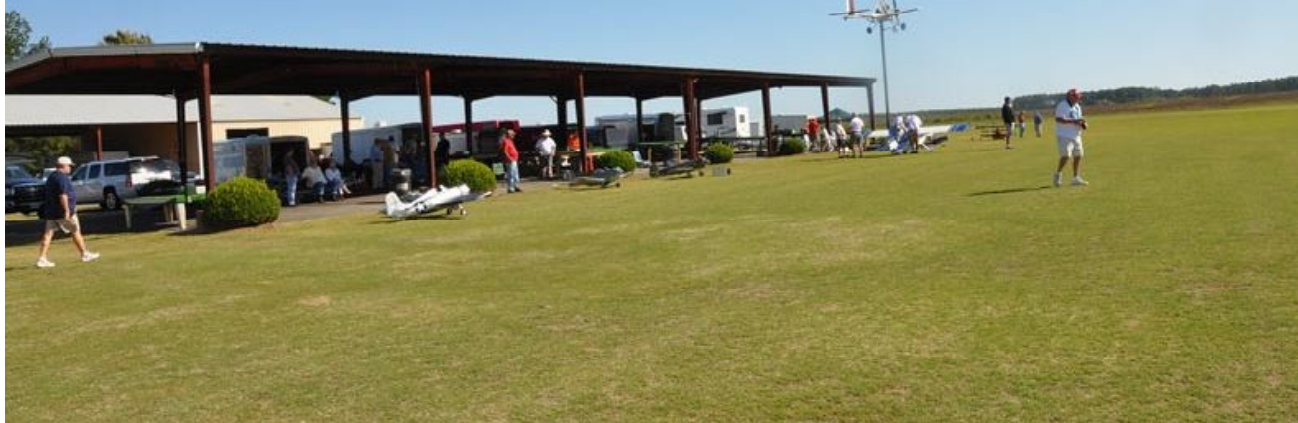
Vy från Mac Hodges flygfält i Georgia.