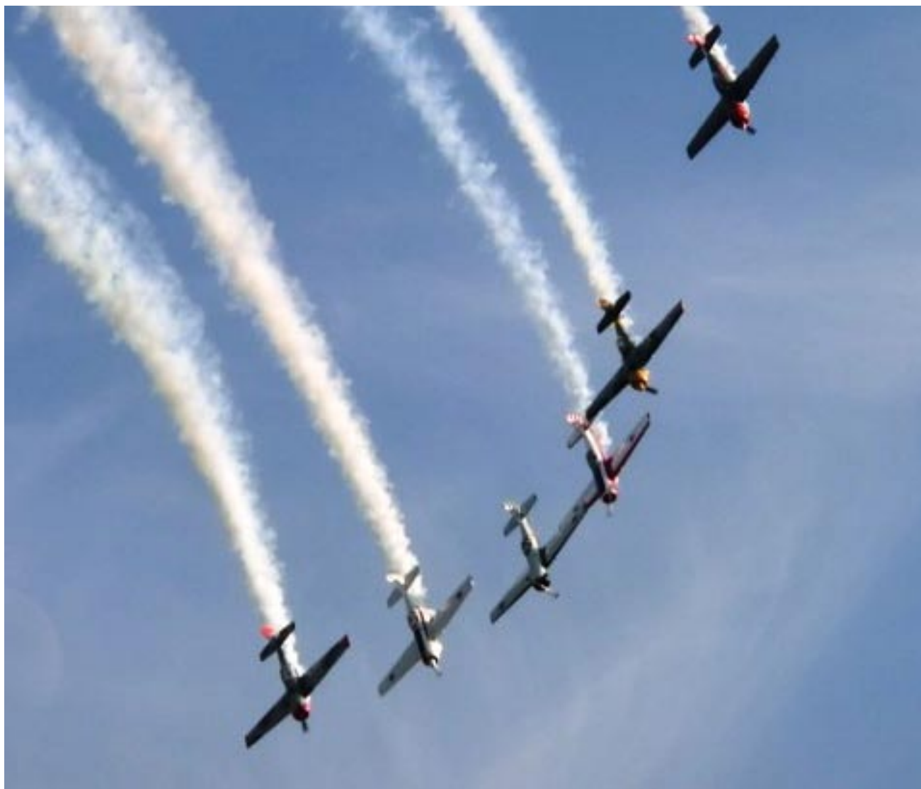
Även Ryssen hittade till Duxford!