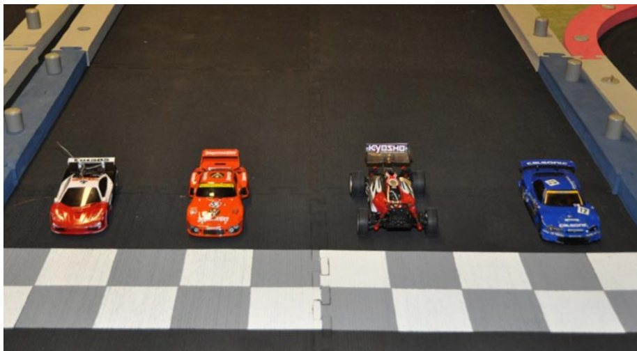
Bilarna står uppställda för start.

NU NÄR HÖSTRUSKET INFALLIT har vi på bilsidan tagit oss inomhus. Vi samlas en gång i veckan i en lokal ute i Stavsjö.