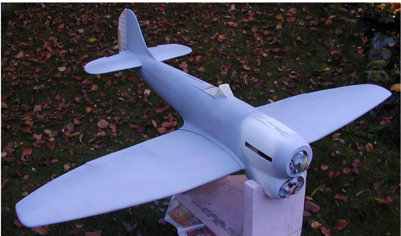
En sprutspacklad Tempest i höstmörkret.

PROFILER HÄR I TIDNINGEN är gjord av Claes Sundin (luftwaffenprofile.se), jag har också fått en högupplöst bild samt en bild bara på emblemet. Två svartvita bilder på EJ705 finns sen tidigare i mitt Tempestarkiv. Så det bör inte vara några problem att få allt rätt!!